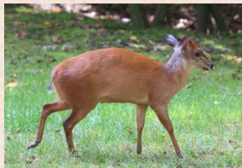
Duiker, Röd/Röd dykarantilop