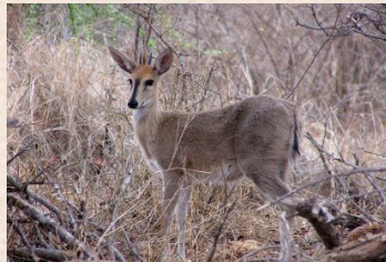
Duiker, Grey/Duiker, Grimm's (Common)