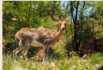
Rörbock, Bergs/Reedbuck, Mountain