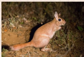
Sydafrikanska fjäder hare