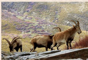
Sierra Nevada Ibex