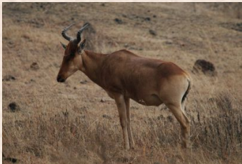
Hartebeest, Lichtensteins/Koantilop, Lichtenstein's