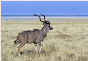
Kudu, Greater/Kudu, Stor