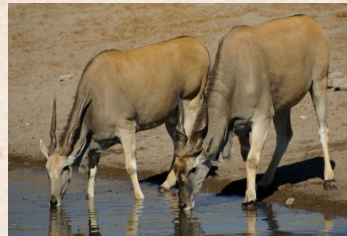
Cape, Eland/älgantilop, Livingstone, Patterson's