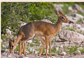
Dik Dik, Damara, Kirk's