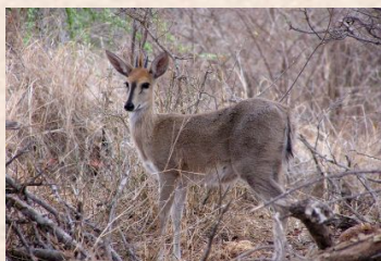
Duiker, Grey/Duiker, Grimm's (Common)