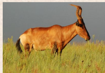
Hartebeest, Red/Koantilop, Röd