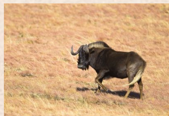
Vitvansad gnu/Black Wildebeest