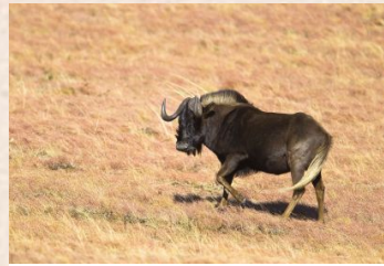
Vitvansad gnu/Black Wildebeest