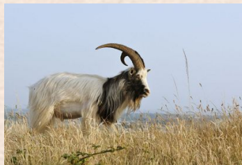
Feral Goat (Sydamerika)