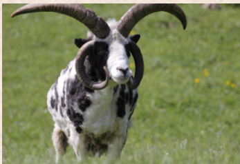
Multi-horned sheep (Sydamerika)